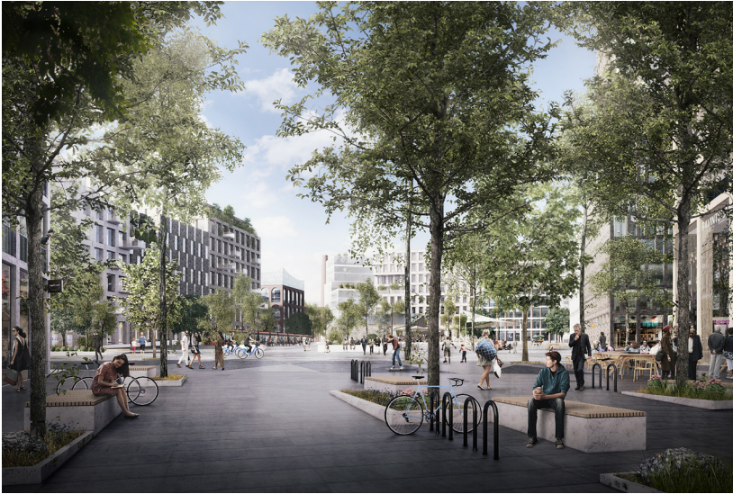
1. Näkymäkuva korkeatasoinen: viimeistelty visualisointi materiaaleilla ja yksityiskohdilla.