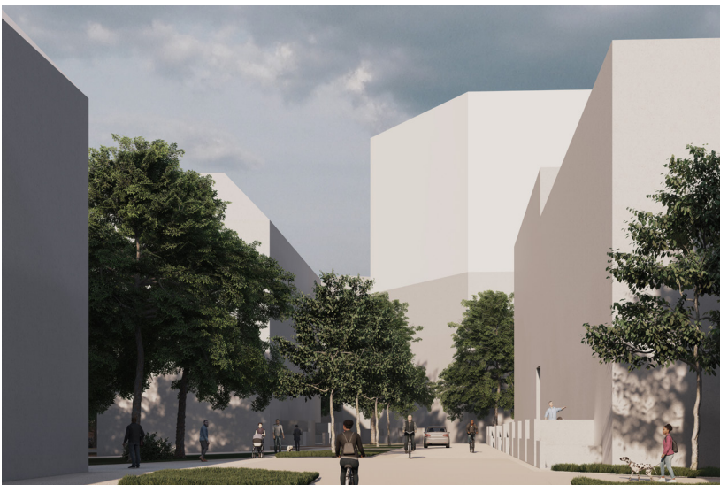
3. Massamallikuva: rakennukset massoina, katu luonnonmaisesti, puustoa, ihmisiä ja katuelementtejä